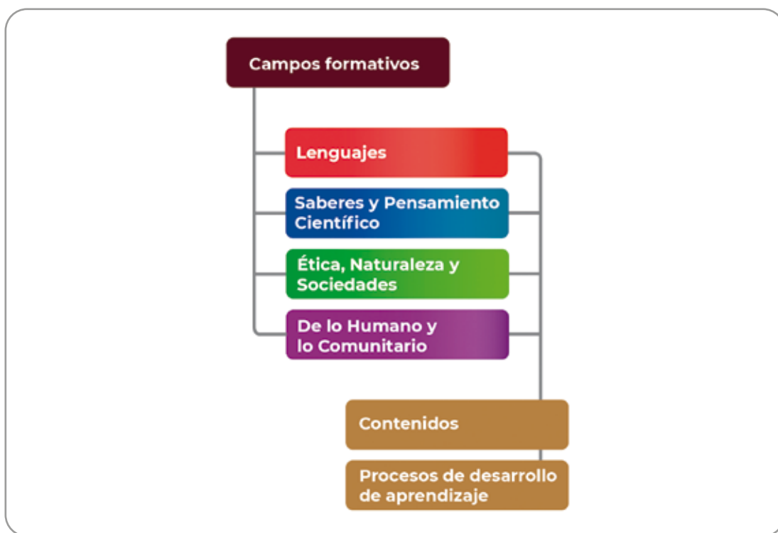
Elementos curriculares de los Programas Sintéticos

Representan recorridos o rutas posibles que dan cuenta de las formas en las que niñas, niños y adolescentes se apropian de aprendizajes que les permiten comprender el mundo que les rodea e intervenir en distintas situaciones.